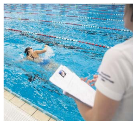
Jeder Zweite fällt durch: Die Eignungsprüfung der Sporthochschule Köln gilt als besonders hart.

nehmer sieben Trainer. „Das ist eigentlich Luxus für die Teilnehmer“, sagt der 56 Jahre alte Rohan. „Und für Sett nicht unbedingt wirtschaftlich. Am optimalen Verhältnis arbeiten wir noch.“ Der frühere Personalchef von RTL sucht derzeit nach weiteren Trainingsorten, den